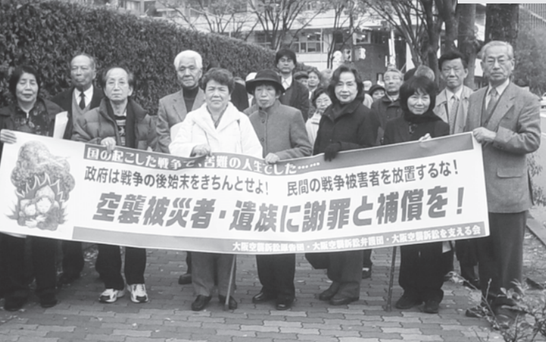
2008年12月8日 大阪地裁に提訴する原告団、弁護団と支援者

大阪でこの裁判が提訴されたのは2008年の12月8日。裁判での勝訴を勝ち取るためにも支援の輪を大きく広げることが不可欠です。どうか、多くの皆さんがこのつどいにご参加いただきますよう、心から訴えます。