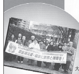
大阪空襲訴訟原告団・弁護団・支える会